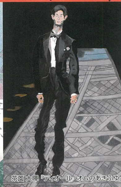
茶蘭 大陣「ティオール・オムのあきふゆ」