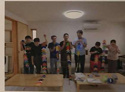
アトリエ ペンライズ

大阪市東住吉区東田辺 3-16-8 TEL 06-7493-1337 ホームページ https://penrise.co.jp/