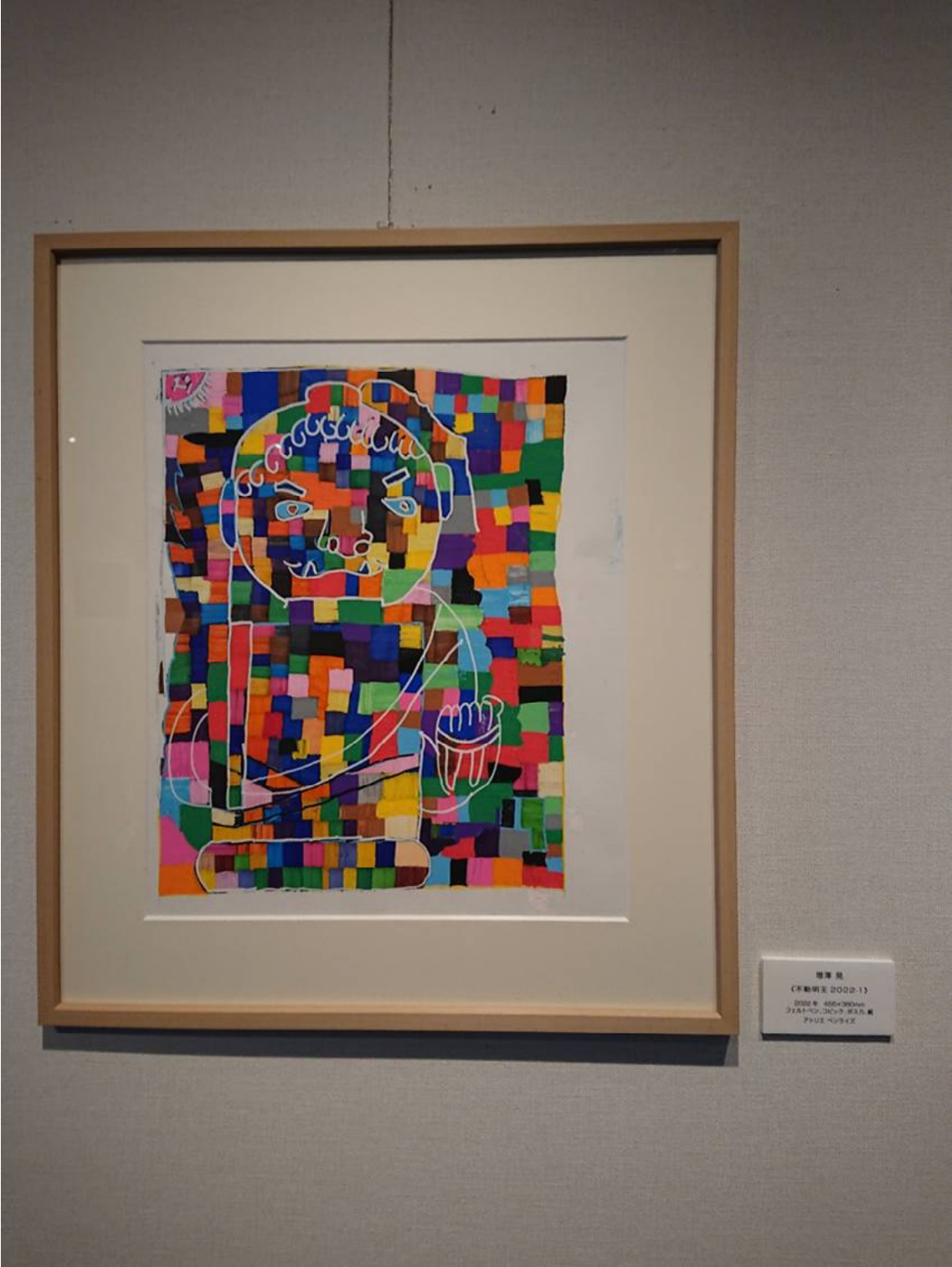
菅原 隆 《菅原隆 2002-1》 2002年 40x30cm アクリル、紙、墨、色紙、絹 7702 ユニクス