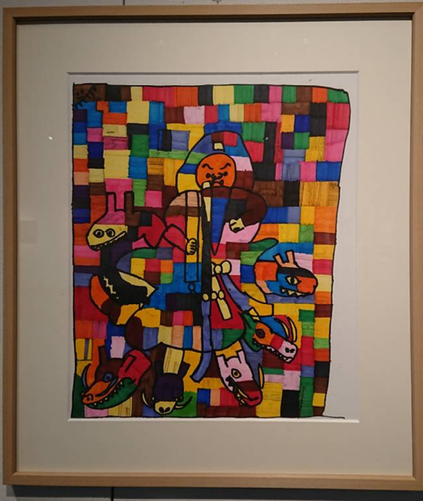
増澤 晃 《スワンオとヤマタノオロチ》 2021年 400×300mm アクリル・マジック・水彩画 アトリエ ペンライズ